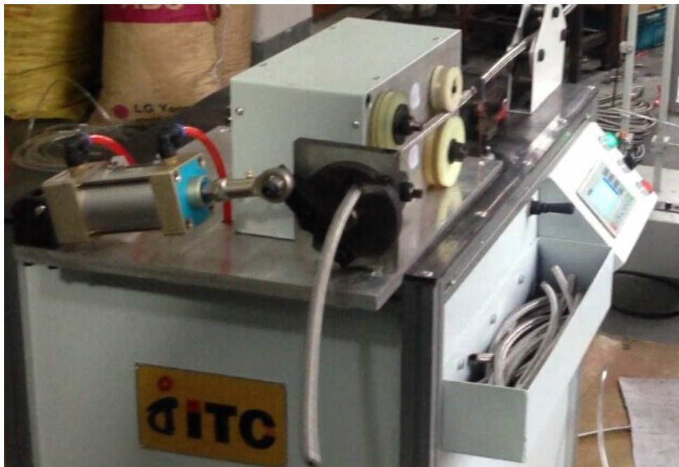
三、 全自动垫片装配机