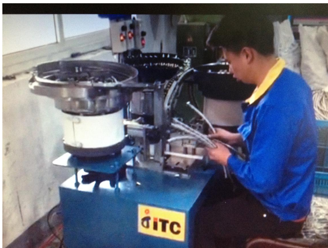
全自动编织管装配机