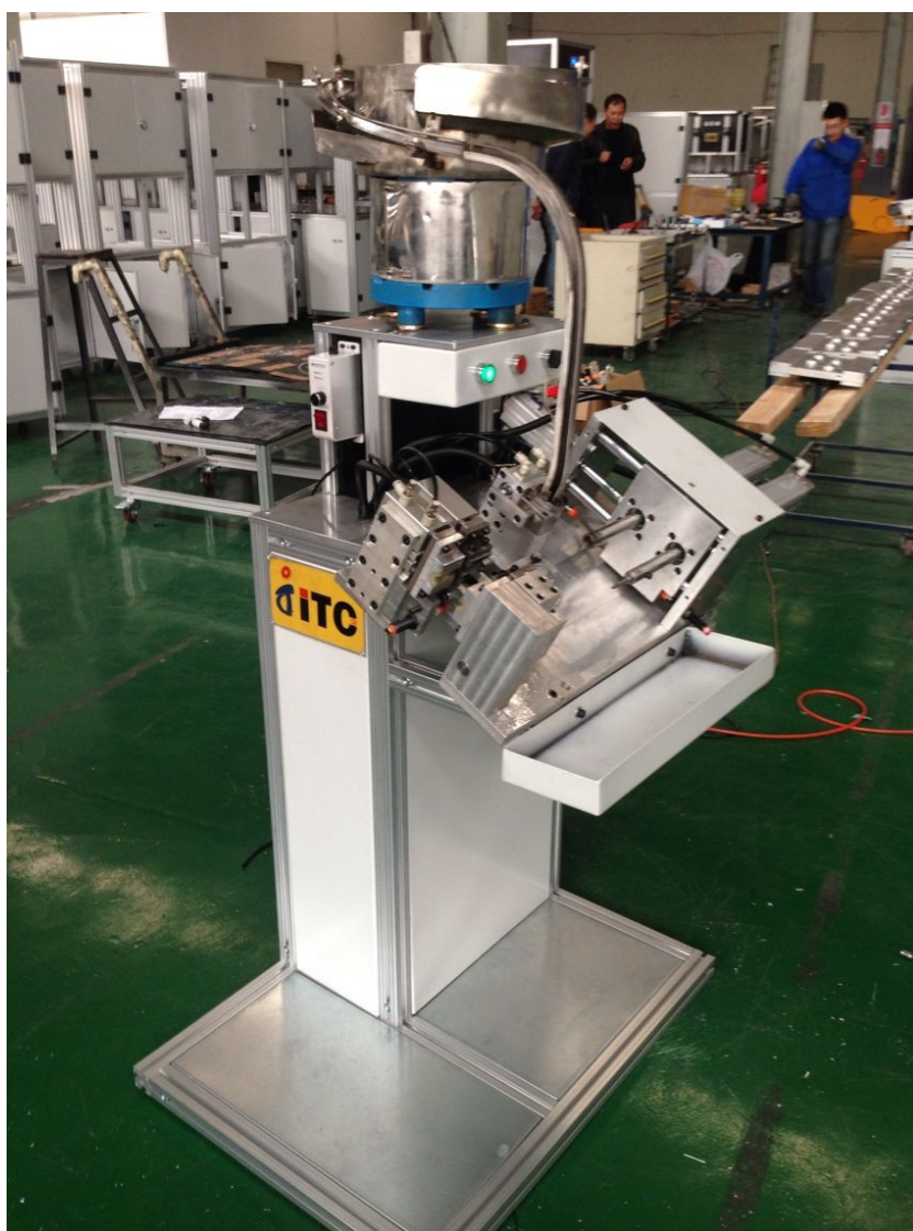
半自动编织管装配机